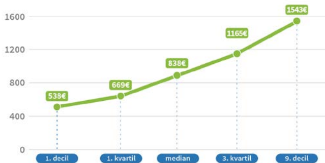
Graf 3: Rozloženie miezd na Slovensku (2016)

Novú výzvu na trhu práce vo viacerých okresoch a sektoroch predstavuje súčasný nedostatok kvalifikovanej pracovnej sily. Pri súčasnej miere nezamestnanosti na historicky nízkych hodnotách zamestnávateľia v niektorých regiónoch a sektoroch čelia ťažkostiam pri získavaní kvalifikovanej pracovnej sily a tlaku na rýchlejšiu rast miezd. Počty voľných pracovných miest na úradoch práce dosahujú historické maximá pri klesajúcej nezamestnanosti. Podľa konjunkturálneho prieskumu v priemysle bol nedostatok zamestnancov ako obmedzujúci faktor výroby označený historicky najväčším počtom zamestnávateľov (NPRSR, 2018).